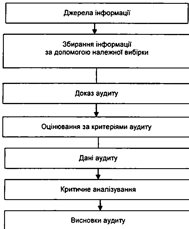
Рисунок 3 — Загальний опис процесу збирання та перевіряння інформації

На рисунку 3 показано загальний опис процесу від збирання інформації до подання висновків аудиту.